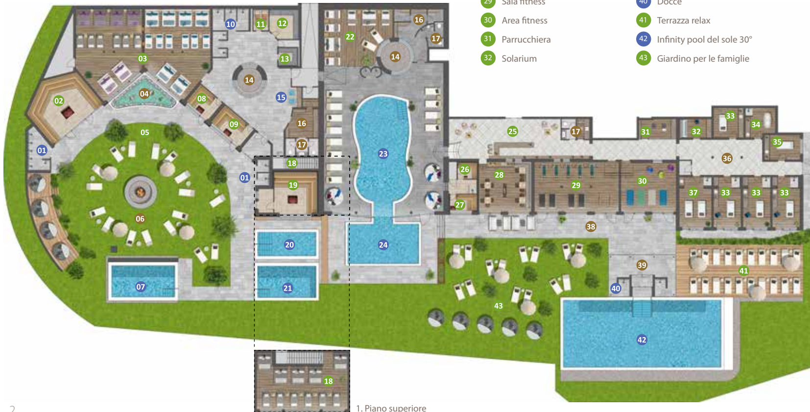
1. Piano superiore